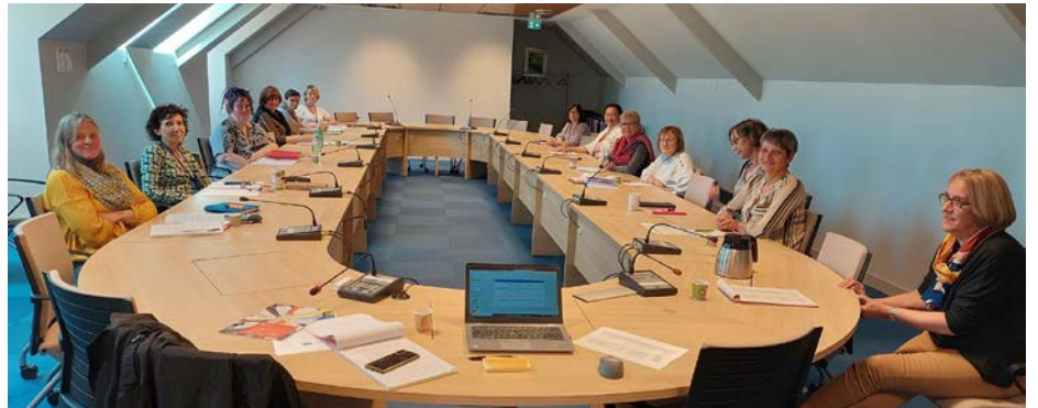
Les travailleurs sociaux de la CAF de Caen.

Ces dispositifs, associés à une sensibilisation aux économies d'énergies, permettent aux travailleurs sociaux d'accompagner plus efficacement les personnes en difficultés de paiement. Une belle façon pour les travailleurs sociaux de la CAF de construire des solutions personnalisées qui répondent aux besoins de leurs bénéficiaires.